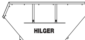
Absetzcontainer 10m 3